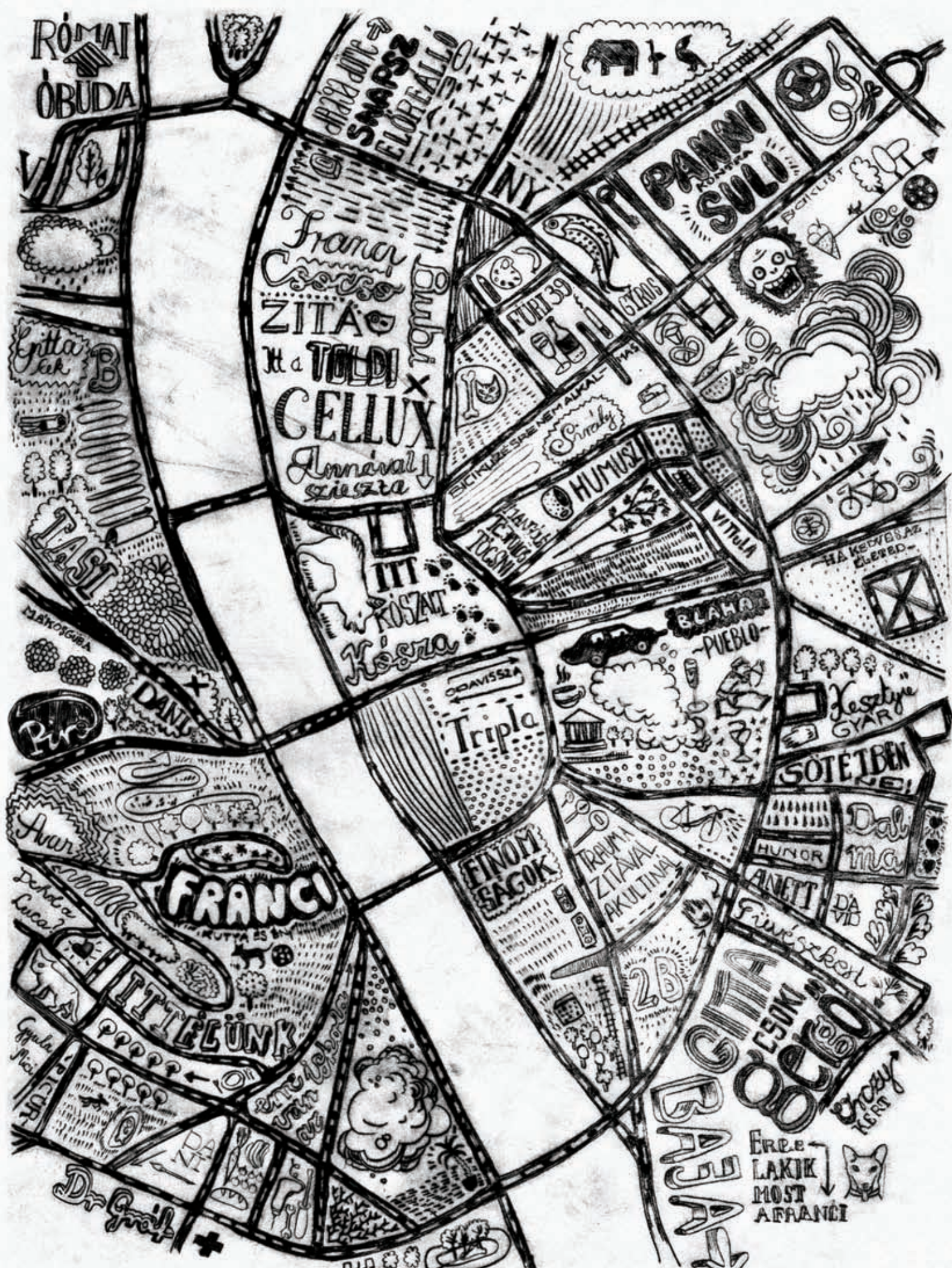
SZUBJEKTÍV BUDAPEST TÉR-KÉPEK SUBJECTIVE BUDAPEST MAPS CENTRÁLIS GALÉRIA 2010.10.20.-12.02.